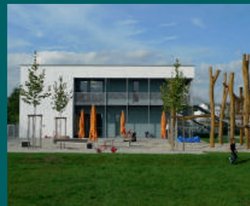
Links: Haus für Kinder in München Rechts: Kooperationseinrichtung in München Unten: Institutsambulanz in Günzburg

philosophie „Wir bauen auf Werte!“ gelebt werden. Eines der abgeschlossenen Projekte ist das Kinderhaus in München-Allach, das im Auftrag der Stadt München realisiert wurde. Nach nur siebenmonatiger Bauzeit konnte es schlüsselfertig an den Bauherrn übergeben werden. Der Architektenentwurf von drei durch SÄBU bereits umgesetzten Einrichtungen wurde für die Kita übernommen. Zahlreiche weitere Kindereinrichtungen, aber auch Hörsäle und Bürogebäude für den Freistaat Bayern konnten so bereits schlüsselfertig und termingerecht übergeben werden. Nicht nur die öffentliche Hand schätzt immer wieder die Zuverlässigkeit und Pünktlichkeit des Allgäuer Betriebs.